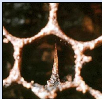
Imagen II: Escama de pupa muerta, con glosa parada.