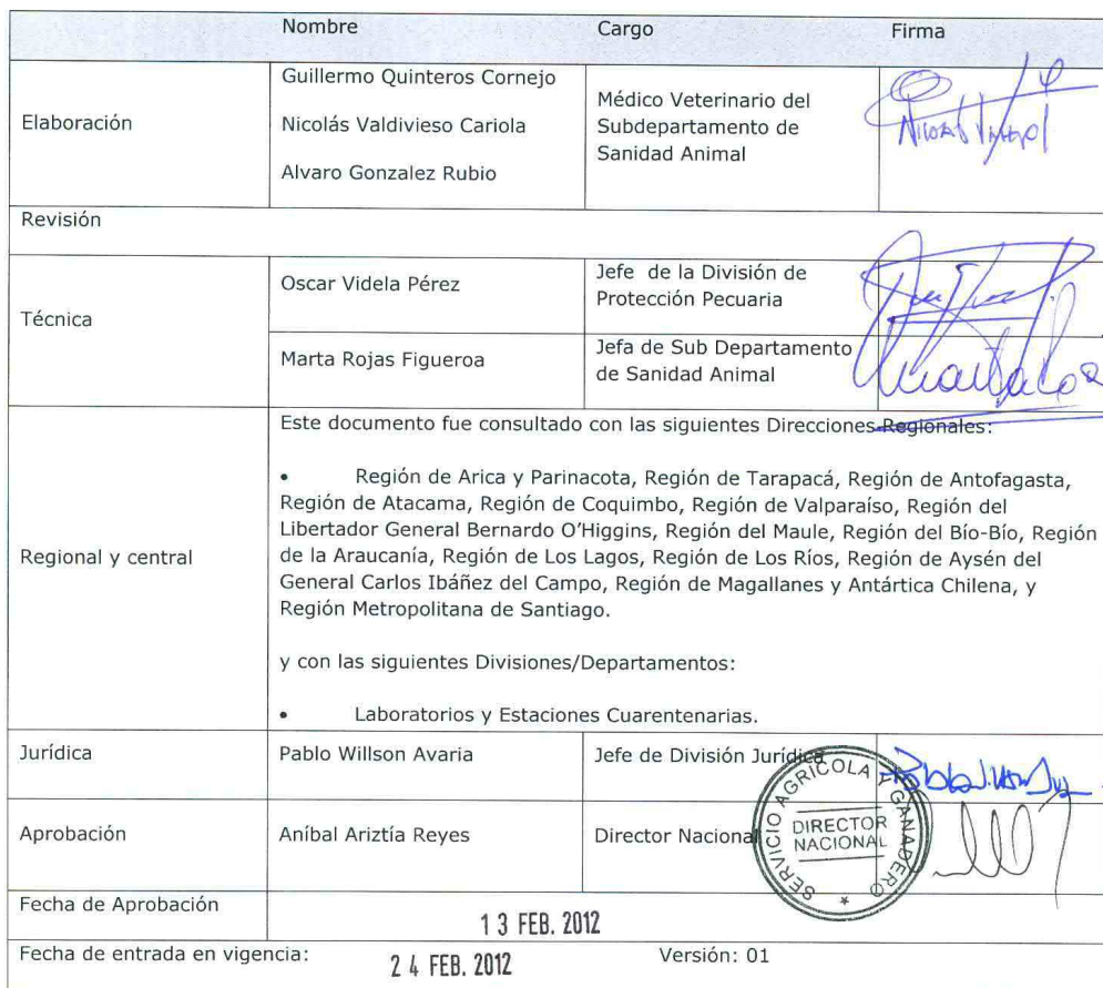
TABLA DE RESPONSABILIDADES