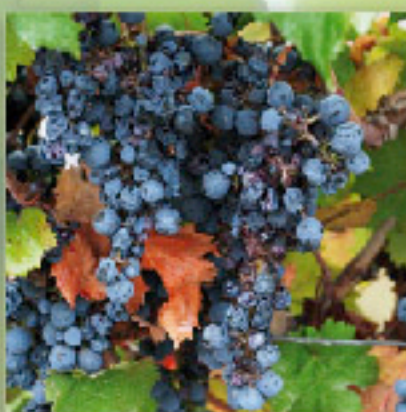
Daño en racimos maduros. Fines de verano.

En este período las larvas inician el proceso de pupación, estado en que pasarán el invierno. En predios donde aún queda fruta en las plantas, es posible detectar larvas en los racimos, observándose un daño característico con bayas deshidratadas, con abundante seda (no confundir con masas algodonosas como las de los chanchitos blancos) y gran cantidad de fecas. La deshidratación de las bayas se produce por el agujero(os) que realiza la larva para alimentarse en su interior. Racimos con esta sintomatología debiesen presentar larvas al interior de las bayas dañadas o entre el racimo y pupas bajo el ritidomo (dentro de puparios formados por capullos de seda blancos). En Europa el daño por Lobesia botrana está asociado a importantes ataques de Botritis y otros hongos causantes de pudrición de racimos.