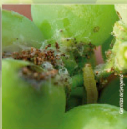
Daño primavera - verano.

Se observan bayas de vid perforadas, podridas o secas por la acción de la alimentación de la larva. Debido a que los frutos se encuentran más desarrollados y duros, no se observa una deshidratación tan evidente como la de los ataques de fines de verano - otoño. Las larvas producen abundante hilos de seda y fecas, ubicándose preferentemente en los racimos donde se refugia entre la seda construida.