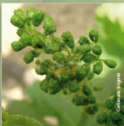
Glómérulos en flores y frutos recién cuajados. Primavera.

La ovipostura se realiza en flores de vid o en sus frutos recién cuajados. Las larvas unen flores y frutitos mediante hilos de seda, produciendo una aglomeración de estos (glomérulos), los que se presentan muy similares al daño observado por larvas de Proeulia . Las larvas de esta primera generación se alimentan de los órganos señalados, y la pupación ocurre entre las hojas o racimos de la planta.