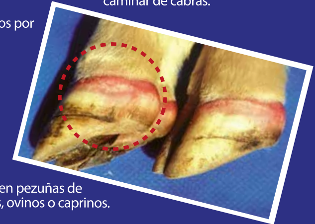
Cojera o heridas en pezuñas de equinos, bovinos, ovinos o caprinos.