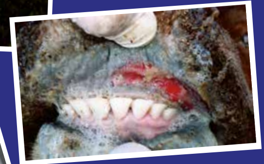
Heridas en hocico, boca y ollares con salivación excesiva (baba en la boca).