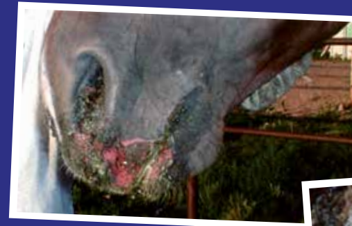
En caballos o yeguas: Hinchazón en patas, genitales o párpados, ojos y nariz con secreción, ollares con costras.