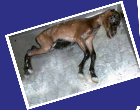
Muerte fulminante de potrillos por problemas de respiración.