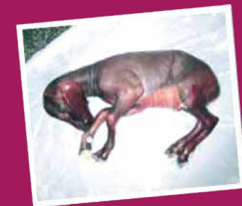
Aborto o crías débiles o deformes en yeguas, ovejas, cabras o bovinos.