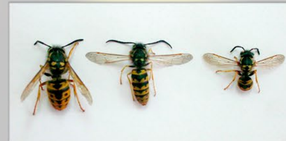
Reina, Macho y Obrera de Vespula germanica , avispa chaqueta amarilla

Cuando comienza la primavera, las personas, animales y plantas nos vemos rodeados de insectos, la mayoría de los cuales son benéficos, aunque también hay algunos dañinos. Entre estos últimos, las avispa son las que causan mayores molestias, siendo las especies introducidas Polistes spp. conocida como avispa papelera y la avispa Vespula germanica , chaqueta amarilla, o avispa carnívora las que más daño producen en las actividades agropecuarias y recreativas. Esta última es la más agresiva y difícil de controlar porque construye sus nidos en el suelo y puede consumir una amplia variedad de alimentos: polen, fruta, carne, otros insectos. También puede atacar al hombre y a los animales como vacas, perros, gallinas y aves.