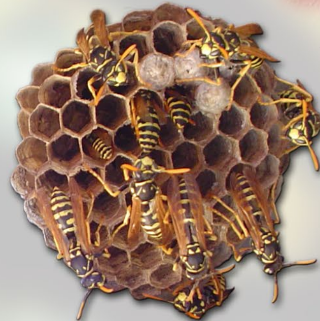
Nido de avispa papelera.