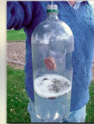
Trampa de botella plástica desechable para avispa chaqueta amarilla.

Construya la trampa con una botella de plástico desechable con dos aberturas en la mitad de la botella, llénela con agua y detergente casi hasta las aberturas, coloque como cebo en su interior un trozo de 2x2 cm de carne con grasa o trozos de pollo, vienasas o longaniza, reemplace el cebo cada 3 días.