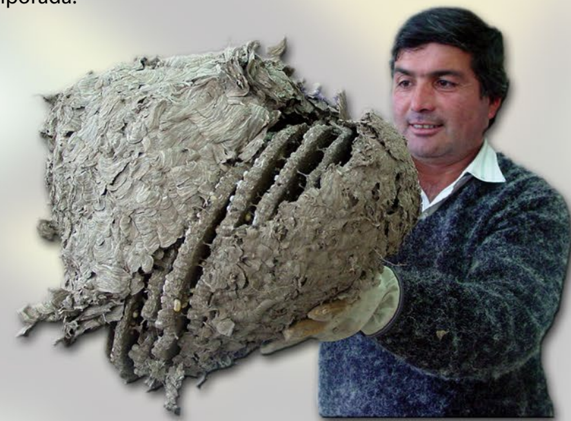
Nido extraído de avispa chaqueta amarilla