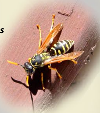
Avispa papelera Polistes sp.

Las avispas papeleras Polistes spp. son de patas largas, abdomen alargado, con mucha cintura, antenas naranjas, hacen nidos con un solo panel y en altura (tejados, árboles). Vuelan muy temprano, a inicios de agosto.