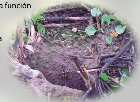
Salida de nido de avispa chaqueta amarilla.

Antes de iniciar cualquier programa de control es necesario conocerla. Saber que son insectos sociales y organizados, que presentan en su nido una reina, encargada de la reproducción; obreras que son responsables de alimentar las larvas, y machos que aparecen a fines del verano y cuya única función es fecundar a las nuevas reinas que invernarán hasta la próxima primavera.